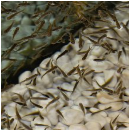
Ictioterapia. Peces Garra Rufa.

Ictioterapia. Se trata de unos pequeños anfibios que comen las pieles muertas dejando la piel sana y limpia.